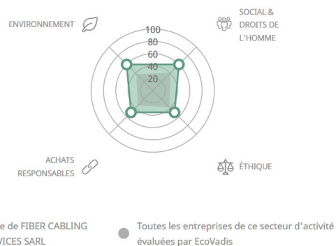
Comparaison des scores de thème

L'obtention du niveau Silver EcoVadis est le témoin de notre engagement en matière de développement durable et un signal fort pour l'ensemble de nos collaborateurs, partenaires et clients. Il nous permet d'affirmer notre rôle de partenaire engagé et responsable.